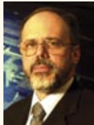
João Jornada Presidente do Inmetro

Cada apresentação do nosso Coral será sempre um momento de reflexão sobre o "todos e o cada um" na vida do Inmetro e sua inserção no todo maior que é o Brasil.