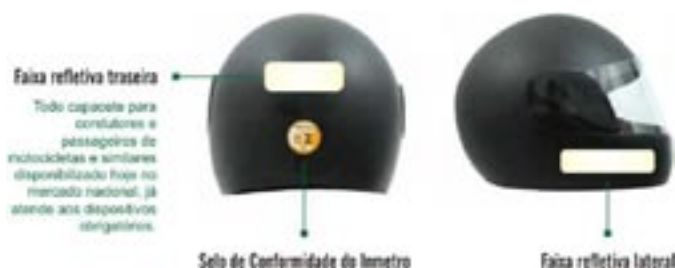
Selo de Conformidade do Inmetro

A descarga emitida durante a exaustão dos veículos movidos à gasolina, álcool e/ou gás natural veicular (GNV) contém uma série de gases poluentes como monóxido de carbono (CO), dióxido de carbono (CO 2 ) e hidrocarbonetos. Para monitorar e manter a emissão desses gases em níveis aceitáveis, é necessário um controle metrológico periódico do aparelho conhecido como "medidor de gases" - instrumento capaz de indicar a quantidade de emissão de gases provenientes da exaustão veicular.